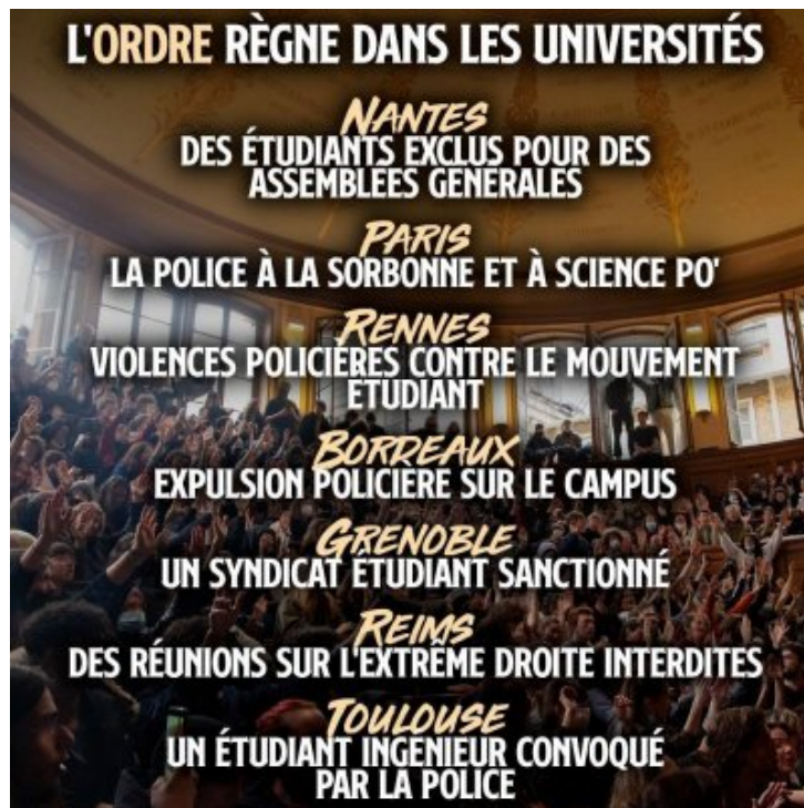
France : répression brutale dans les universités, comme dans les pires régimes autoritaires