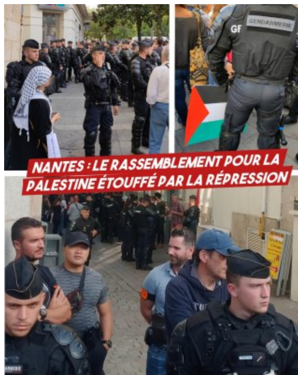
Palestine - Israël : le contexte compte, répression des manifs en France, deux poids deux mesures