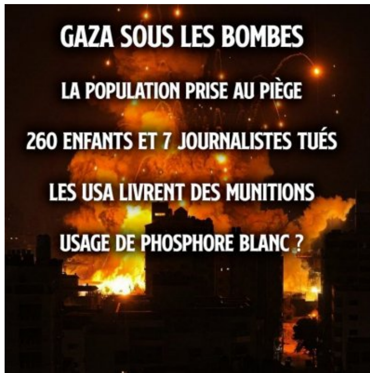
Palestine - Israël : le contexte compte, répression des manifs en France, deux poids deux mesures