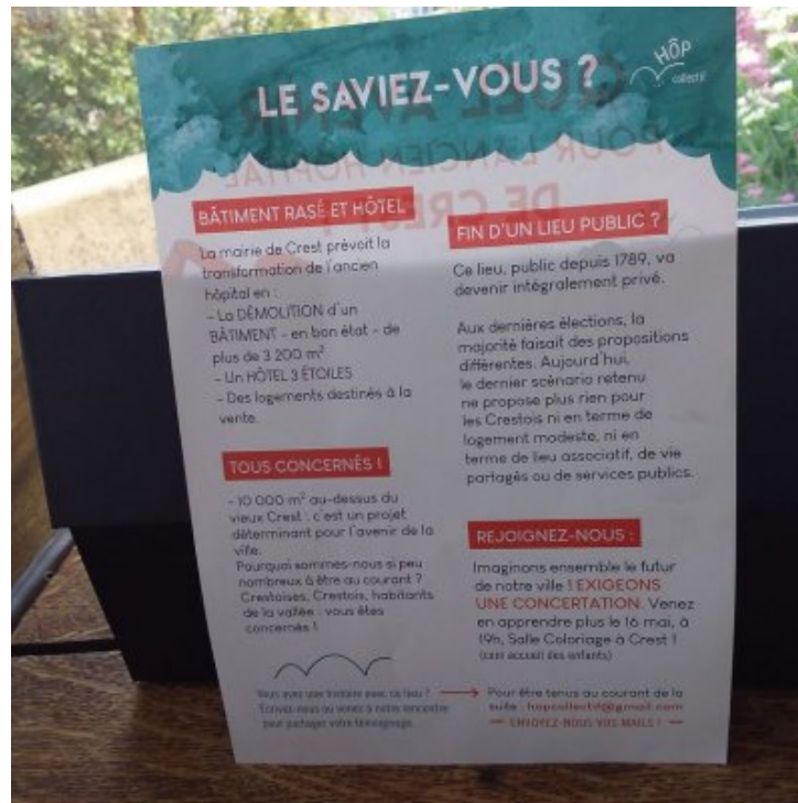
Quel avenir pour l'ancien hôpital de Crest ? Réunion publique le 16 mai