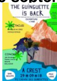
The Guinguettes is Back, Crest - affiche du 29 septembre

(qui s'inclue dans la quinzaine de l'exil - Soirée d'ouverture le jeudi 27 septembre à Crest au cinéma l'Eden )