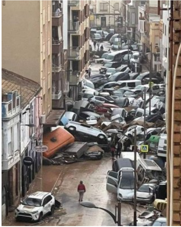
Inondations géantes en Espagne, plus de 100 morts, qui aurait pu prédire ?