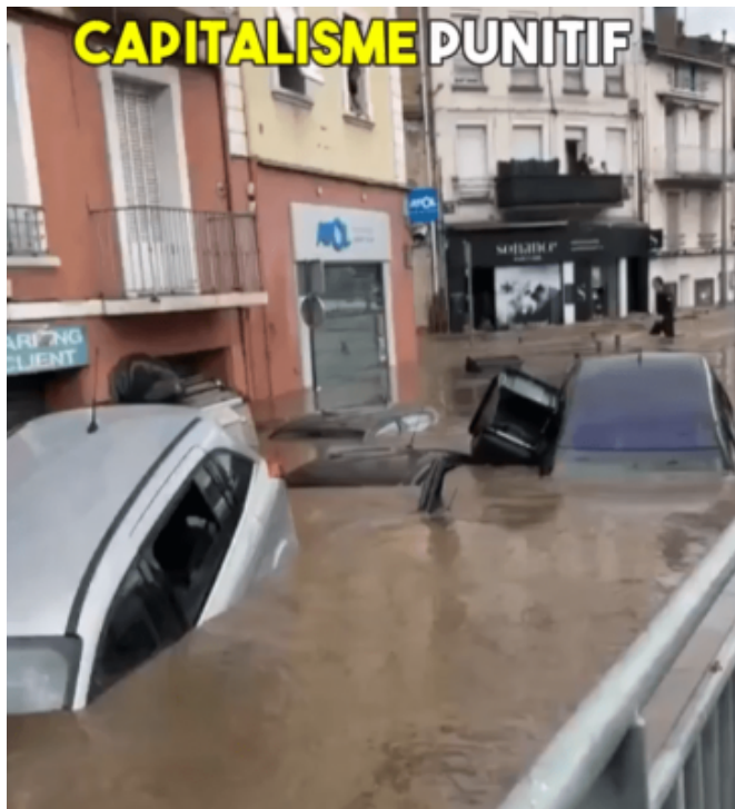
Inondations records avec gros épisode Cévenole, qui aurait pu prédire ?