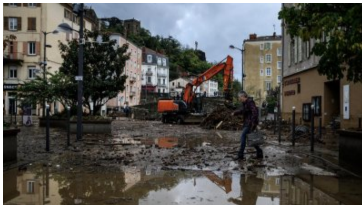
Inondations records avec gros épisode Cévenole, qui aurait pu prédire ? après la crue à Annonay