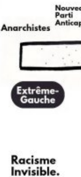
Le paysage politique réel / le paysage politique dans les médias dominants