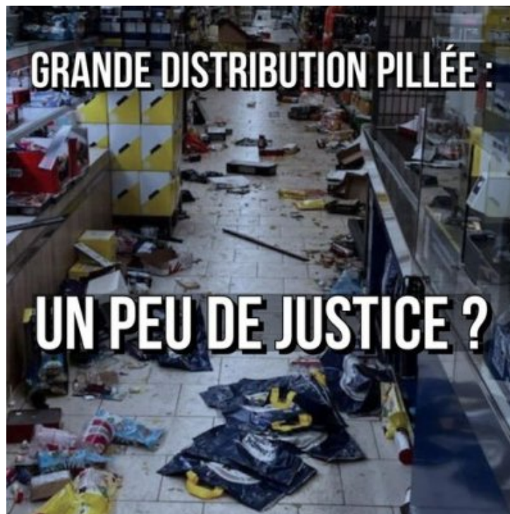
Révolte pour nahel : une répression ultra-violente largement passée sous silence