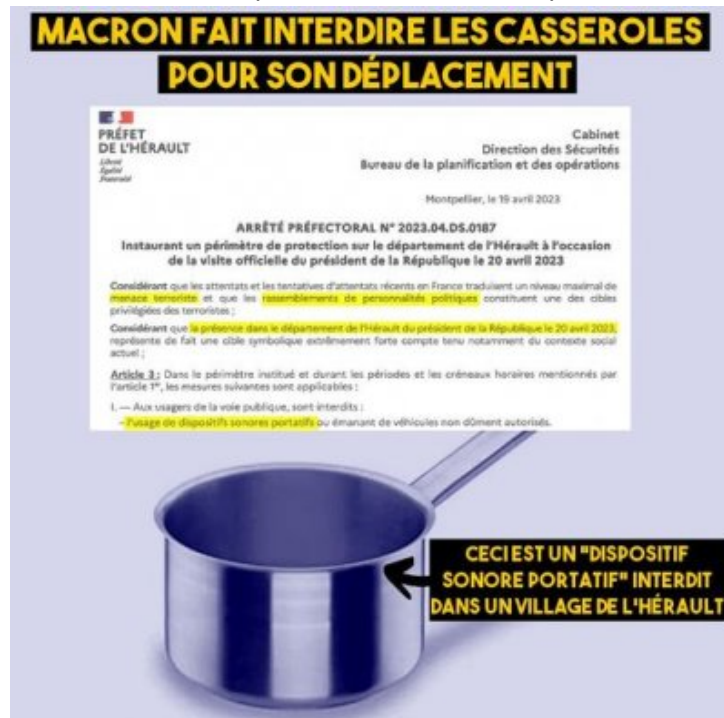
Révolte déclenchée par la réforme retraites : guérilla sociale et casseroles partout

A Frustration, nous sommes davantage envahi par la joie de la guérilla qui s'annonce que paralysé par la peur du pire. Car l'histoire nous apprend que le fascisme a toujours été rendu possible par l'action délibérée des classes dominantes pour juguler les envies de révoltes populaires. Car nous voyons que tout de suite et maintenant, on a plus à craindre du déjà-là fasciste de Macron que nous observons en ce moment que du péril fasciste de Le Pen que l'on nous invite à anticiper. Il faut continuer à faire feu de tout bois et rejoindre cette guérilla qui se dessine : perturbation des hypermarchés, blocage des réseaux de transport, empêchement des événements sportifs, concours régionaux de bordélicisation de déplacements ministériels... Libérons-nous donc de la peur du pire et n'ayons pas peur d'espérer le mieux : l'extension du chaos émancipateur et la chute du despote.