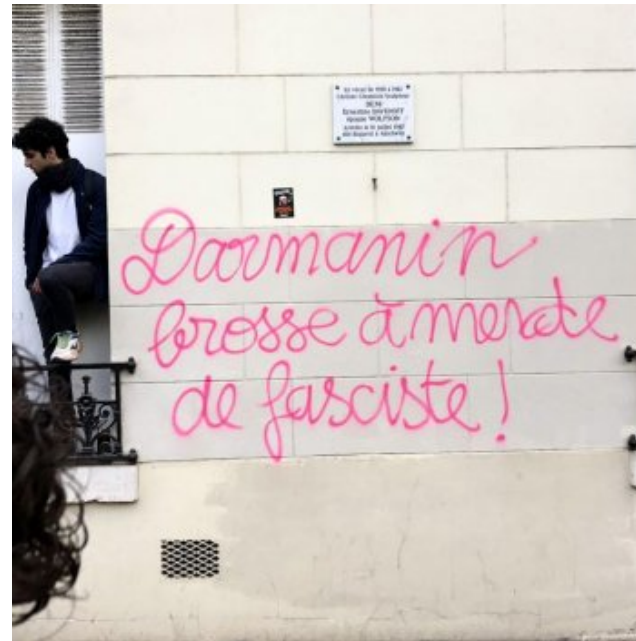
Révolte initiée par les retraites : blocages et actions nombreux le 6 avril