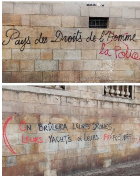
Révolte initiée par les retraites : blocages et actions nombreux le 6 avril - Désobéissance et rage