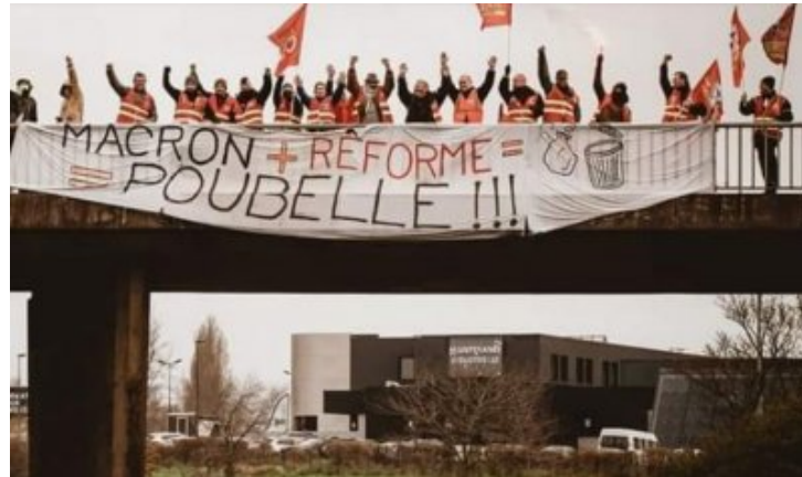
Révolte initiée par les retraites : blocages et actions nombreux le 6 avril - Désobéissance et rage Le macronisme à la poubelle, et le reste suivra

Tous les humains rigoleraient fort, s'énerveraient encore plus et leur jeteraient plus d'objets à la figure, et s'activeraient avec entrain pour brûler leurs soucoupes volantes, leurs usines et leurs machines.