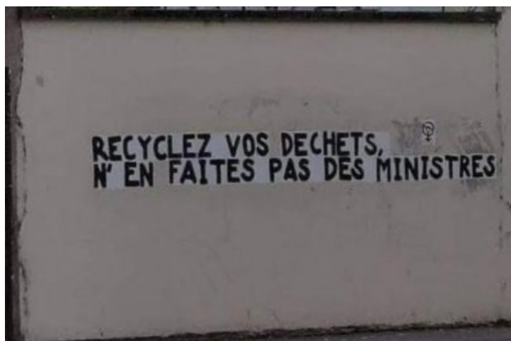
Retraites etc. : la pression monte, actus des grèves & blocages