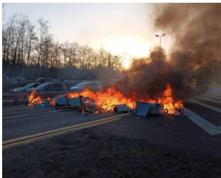
Retraites etc. : la pression monte, actus des grèves & blocages