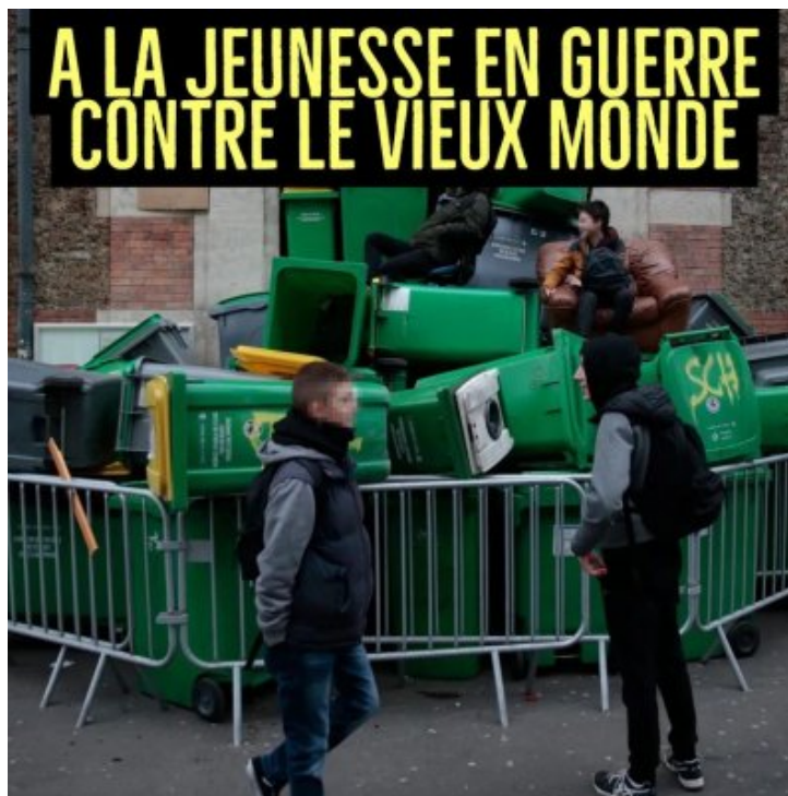
Retraites : des grèves économiques à la grève générale politique ?