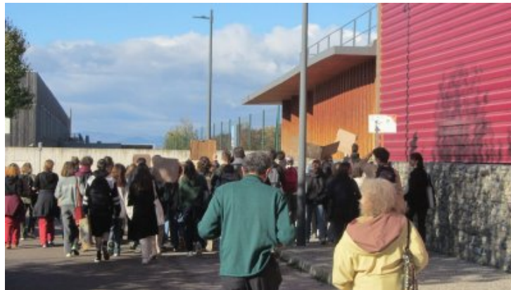
Des jeunes ont manifesté pour le climat à Crest vendredi 18 novembre