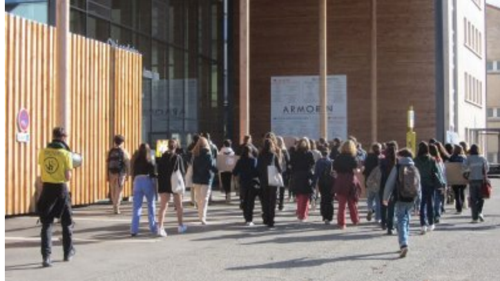
Des jeunes ont manifesté pour le climat à Crest vendredi 18 novembre Devant Armorin

D'autres actions vont-elles avoir lieu ailleurs en Drôme avec d'autres élèves ?