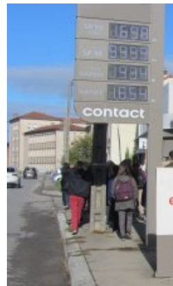
Des jeunes ont manifesté pour le climat à Crest vendredi 18 novembre Devant la station de TOTAL, la multinationale ennemie de la biosphère