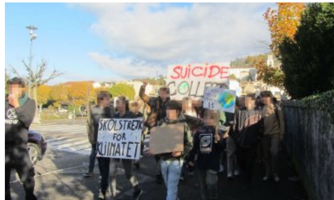
Des jeunes ont manifesté pour le climat à Crest vendredi 18 novembre