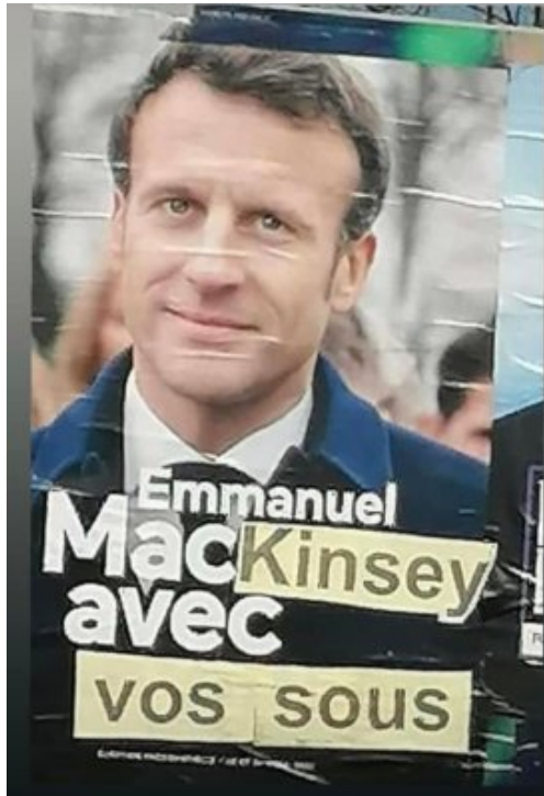
Cabinet de conseil McKinsey : des rapports ultra-libéraux à prix d'or

En effet, invité du Journal de France 3 hier, Emmanuel Macron a été obligé de réagir à ce sujet, en dépit d'un agacement très visible.