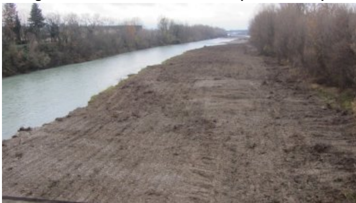
Crest : destruction des arbres d'une zone de berge de la rivière Drôme en bas du parc du Bosquet et en aval En aval du pont en bois