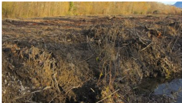
Crest : destruction des arbres d'une zone de berge de la rivière Drôme en bas du parc du Bosquet et en aval