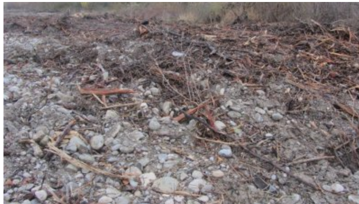
Crest : destruction des arbres d'une zone de berge de la rivière Drôme en bas du parc du Bosquet et en aval Champ de ruines en aval du pont SNCF