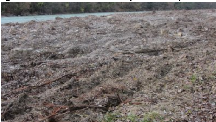
Crest : destruction des arbres d'une zone de berge de la rivière Drôme en bas du parc du Bosquet et en aval Sol labouré en aval du pont SNCF