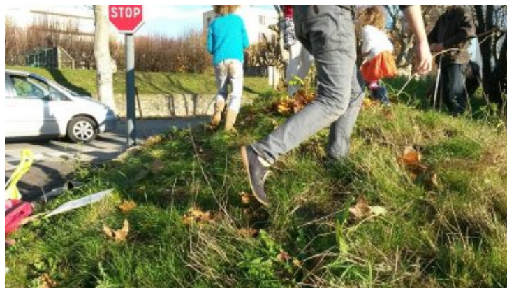
Crest, novembre 2016, plantation d'arbres fruitiers dans l'espace public