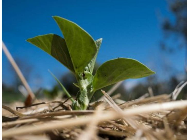
Crest : jardin collectif partagé aux Sétéreés, les fèves sortent