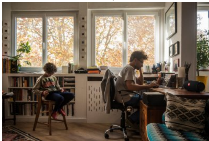
Une famille à Toulouse, novembre 2020.

La détermination de l'État à déployer la 5G est très compréhensible. L'objectif est de démultiplier le débit d'Internet pour radicaliser l'addiction d'un grand nombre de gens au numérique et pour mettre en relation des milliards d'objets connectés. Seulement, il y a un imprévu : une partie de la population se méfie de ce projet, à tel point que certains politiciens se prononcent contre - fait exceptionnel. Même des personnes qui n'avaient jusqu'ici aucun problème avec l'usage intensif des technologies trouvent que cela va trop loin, à l'image du mouvement des « gilets jaunes », largement tributaires des réseaux sociaux mais au sein desquels des mots d'ordre anti-5G étaient apparus.