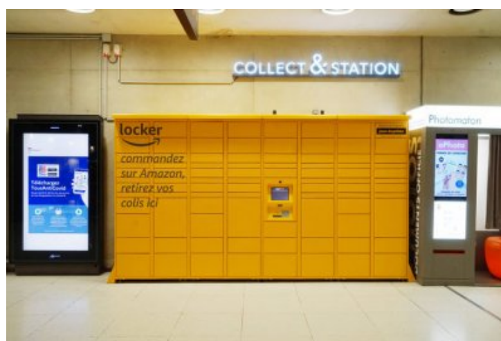
Point de retrait Amazon à la gare du Nord (Paris), novembre 2020.