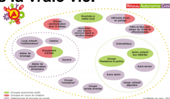
Schéma des Groupes du Réseau Autonomie Crest

Bonne visite, et surtout à bientôt sur le terrain et dans nos réunions diverses, car rien ne peut remplacer les rencontres dans la vraie vie.