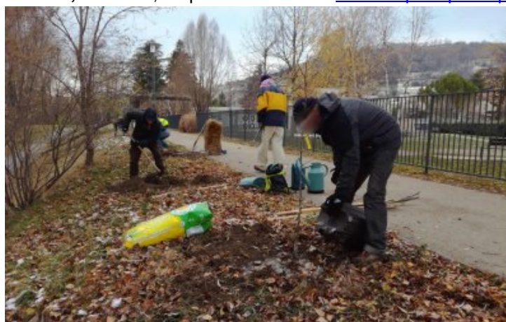
03 décembre 2017 : plantation de 8 arbres fruitiers à Crest