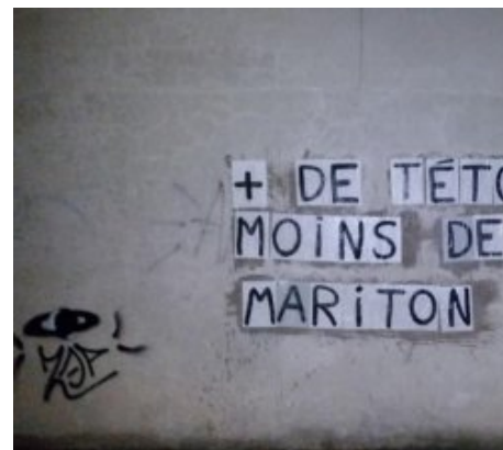
De nombreux collages féministes sur des murs de Crest + de têtes, moins de Mariton