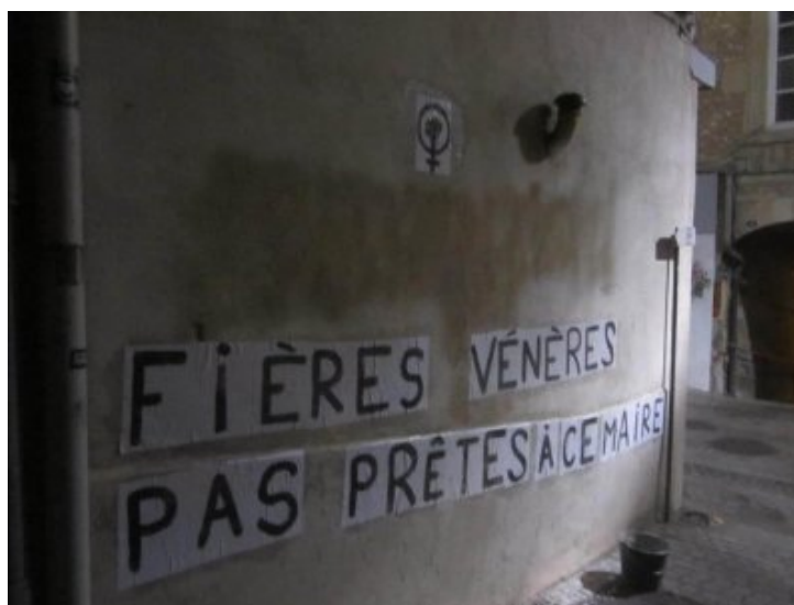
De nombreux collages féministes sur des murs de Crest