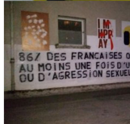
De nombreux collages féministes sur des murs de Crest 86% des françaises ont été victimes au moins une fois d'une forme d'atteintes ou d'agression sexuelle dans la rue