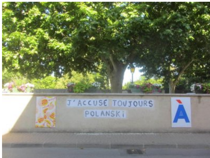
De nombreux collages féministes sur des murs de Crest J'accuse toujours Polanski