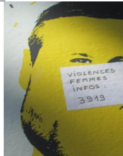
De nombreux collages féministes sur des murs de Crest