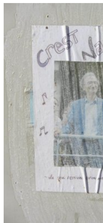
De nombreux collages féministes sur des murs de Crest