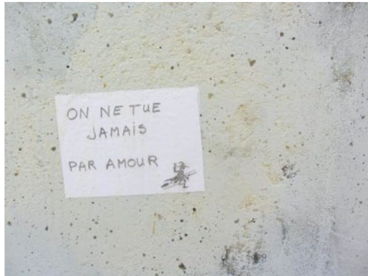
De nombreux collages féministes sur des murs de Crest On ne tue jamais par amour