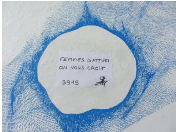
De nombreux collages féministes sur des murs de Crest