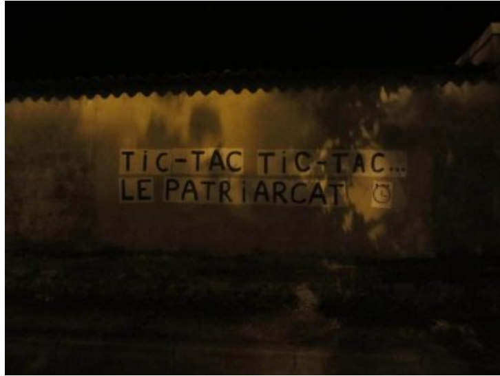
De nombreux collages féministes sur des murs de Crest Tic-tac tic tac le patriarcat