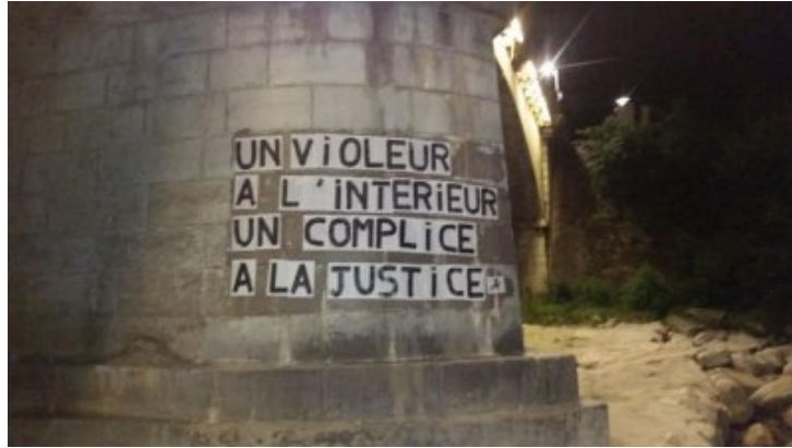
De nombreux collages féministes sur des murs de Crest Un violeur à l'intérieur, un complice à la justice

De nombreux collages féministes sur des murs de Crest