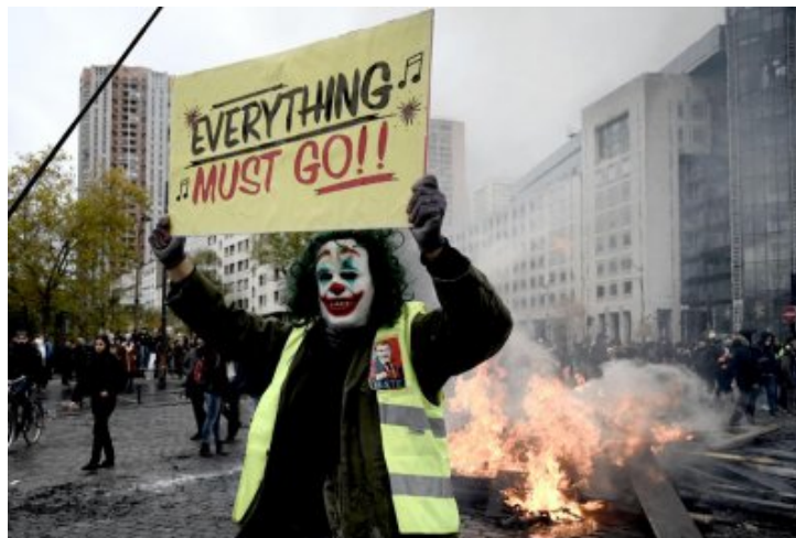
Des rebelles et des zombies manifestent en même temps