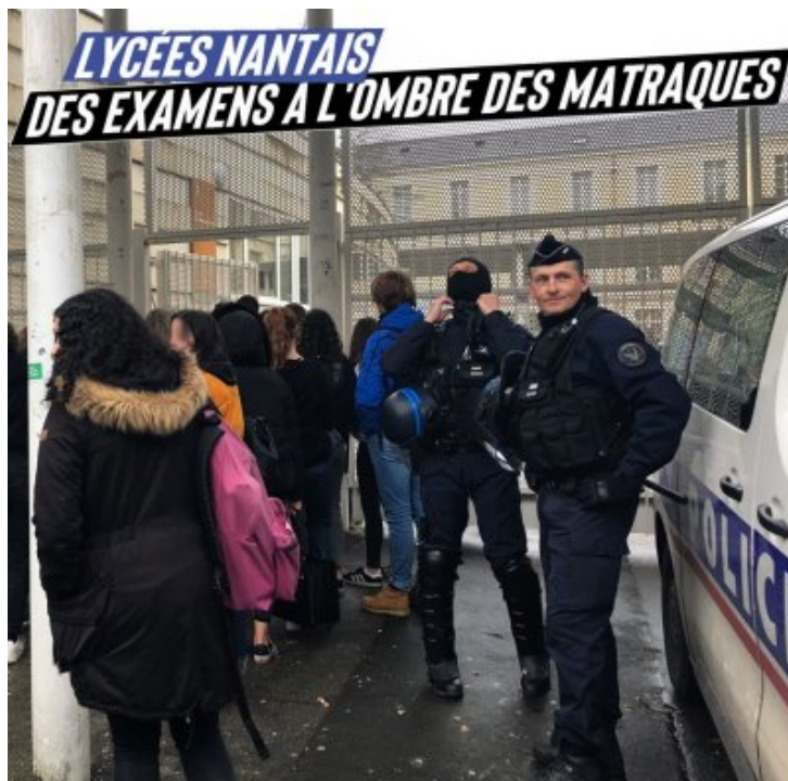
LYCÉES NANTAIS : DES EXAMENS A L'OMBRE DES MATRAQUES