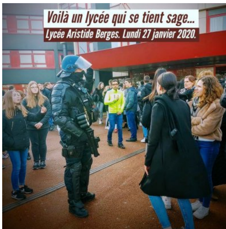
Des flics dans un lycée sur Grenoble