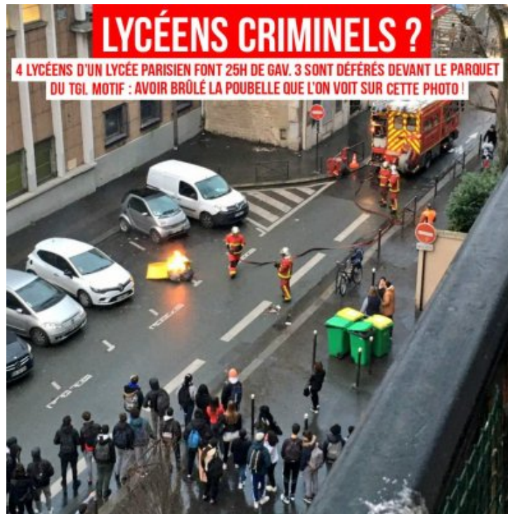
Semaine noire pour les lycéens en lutte partout en France