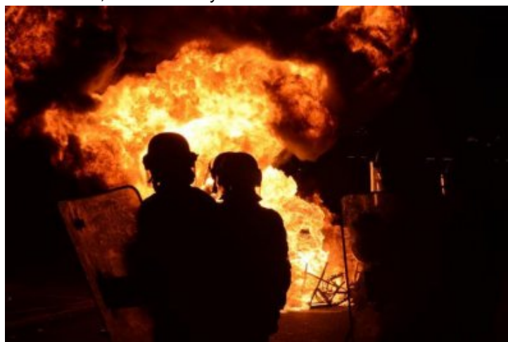
Paris 18 janvier 2020 acte 62 : insurrection permanente, latente, mais profonde

La première manif sauvage a réussi à sortir du cortège en milieu d'après midi, au niveau de Gare de L'Est. La fin de journée et le début de soirée sera l'occasion d'autres manifs sauvages mais aussi d'actions offensives au niveau de l'arrivée de la manif déclarée, à Gare de Lyon.