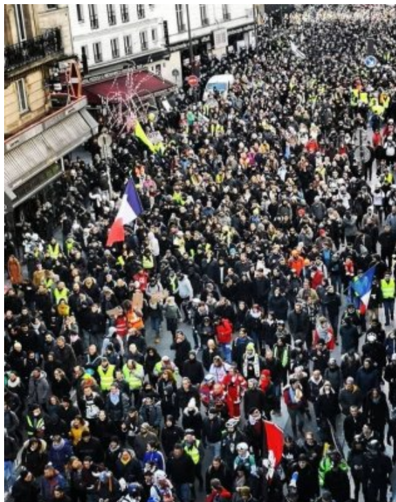
Paris 18 janvier 2020 acte 62 : insurrection permanente, latente, mais profonde 5 à 10 000 personnes ?

Paris 18 janvier 2020 acte 62 : insurrection permanente, latente, mais profonde La manif grossie au fur et à mesure du parcours