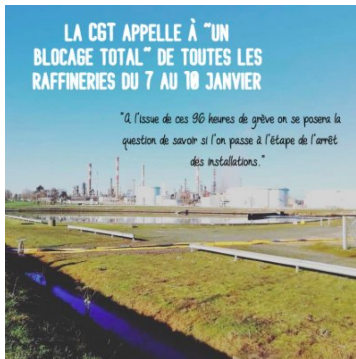
Appel à blocage total des raffineries en janvier