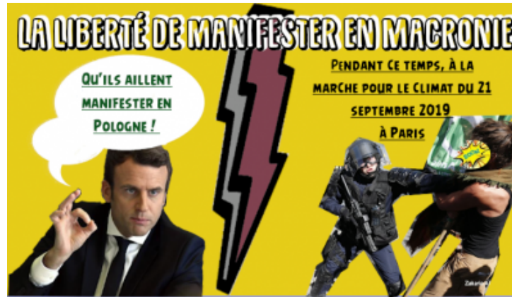
La liberté de manifester dans le régime macroniste