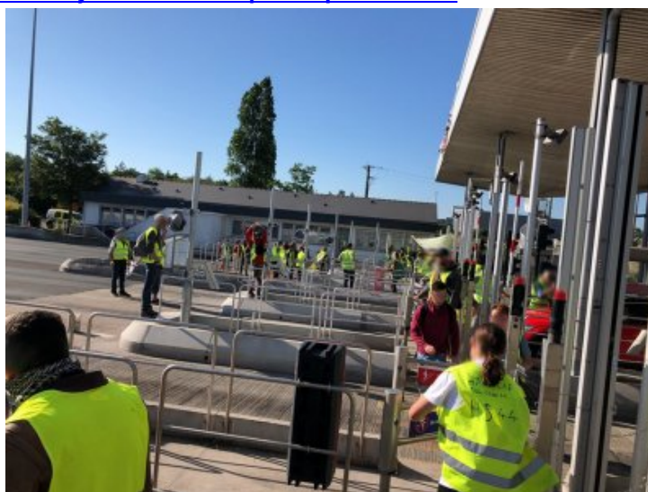
22 juin : journée d'action - Le péage d'Ancenis ouvert