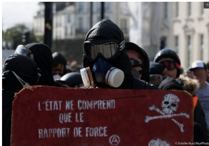
Nantes Révoltée : 2 mars 2019