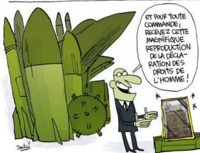
Ventes d'armes record de la france en 2016