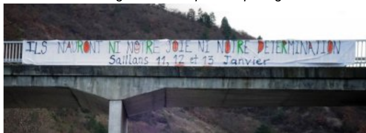
Banderole à Saillans sur la nationale, festival de soutien