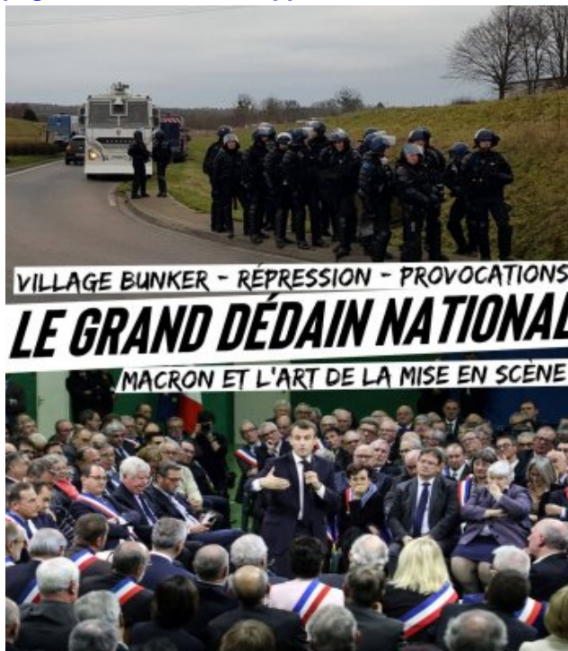
Le grand dédain national