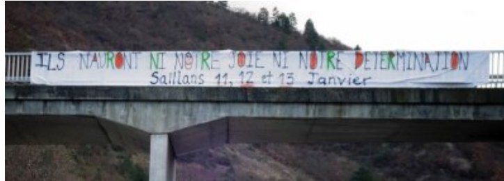
Banderole à Saillans sur la nationale, festival de soutien

Voici un petit résumé rapide, n'hésitez pas à compléter.