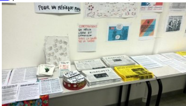
Saillans, festival de soutien les 11-12-13 janvier, stand presse Ricochets