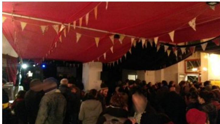
Vendredi 11 janvier - Saillans, festival de soutien aux 4 condamnés de Valence

Après une pièce de théâtre locale, les concerts se sont enchaînés.