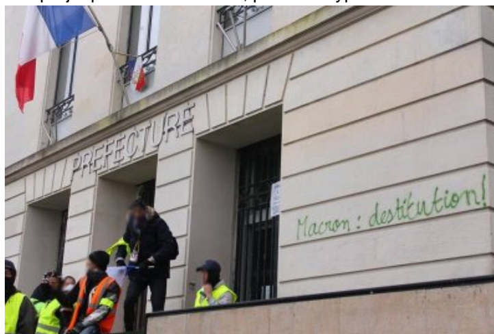
Nantes 22 décembre, la préfecture est assiégée

Il y a de la place dans ce vaste projet pour tout le monde, pour tout type d'actions et de soutiens.