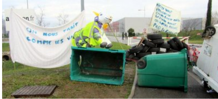
Montélimar samedi 22 décembre, barricade et banderoles devant Amazon

Des gilets jaunes arrivaient petit à petit de toute la région, de Drôme et d'Ardèche.