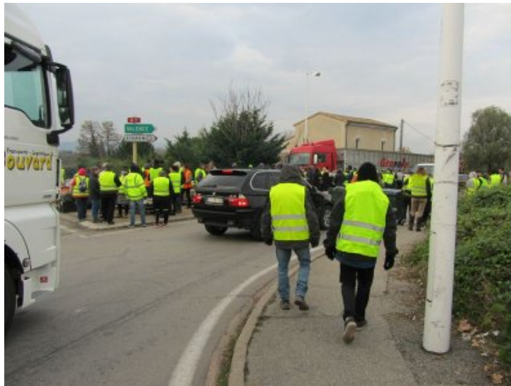
Drôme, Loriol : blocage gilets jaunes au rond point, 19 novembre 2018

La détermination est nettement plus forte à Livron et Loriol, où de gros barrages bloquent la Nationale au niveau du pont de Livron sur la Drôme et du rond point de Loriol depuis samedi 17 novembre. Ils sont déterminés à rester coûte que coûte, soutenons-les !