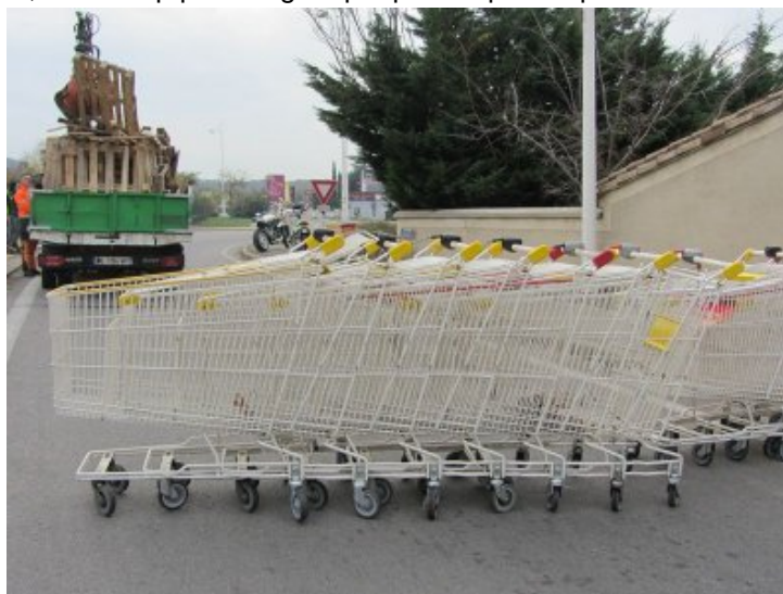
Drôme, Loriol : blocage gilets jaunes au rond point, 19 novembre 2018

L'idée partagée était de ne pas bloquer des heures les voitures et camions, mais les barrages fermés duraient quand même un bon moment, beaucoup plus longtemps que ce qu'on a pu voir à Crest.