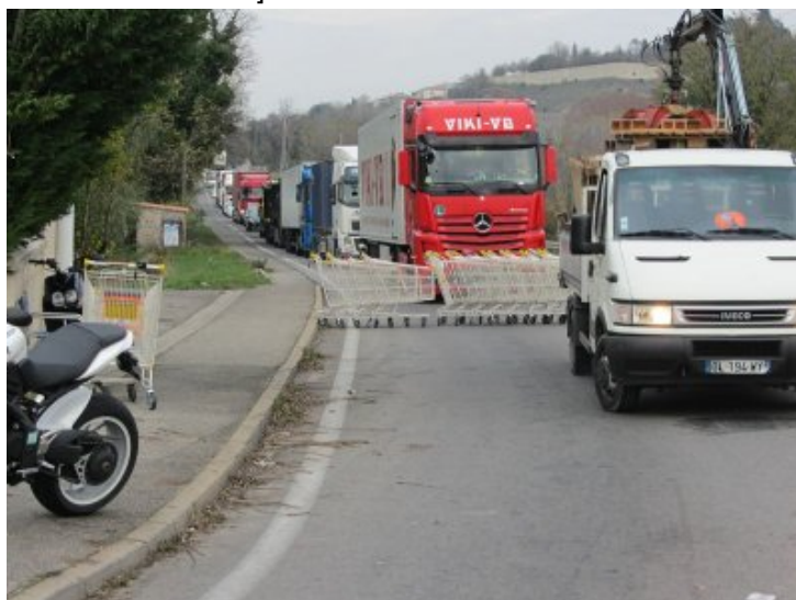
Drôme, Loriol : blocage gilets jaunes au rond point, 19 novembre 2018, les camions bloqués