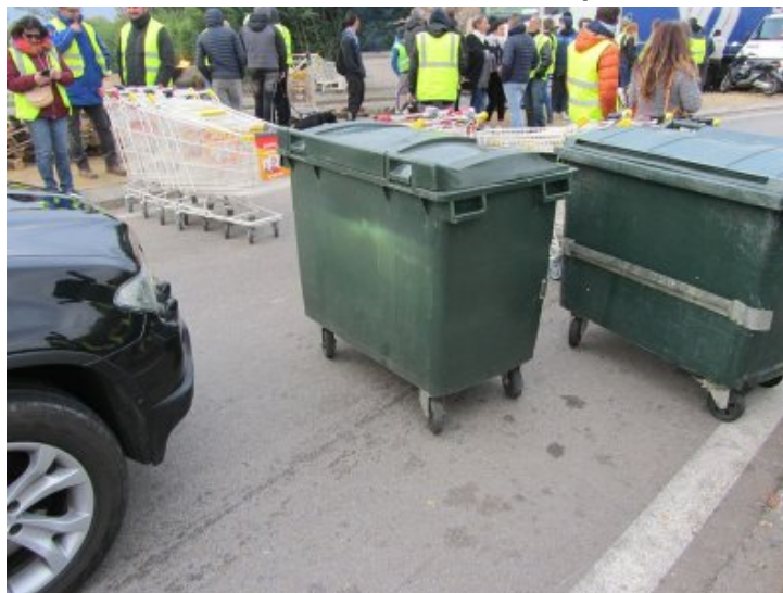
Drôme, Loriol : blocage gilets jaunes au rond point, 19 novembre 2018

Dans la Drôme, quasiment toutes les sorties d'autoroutes sont bloquées !