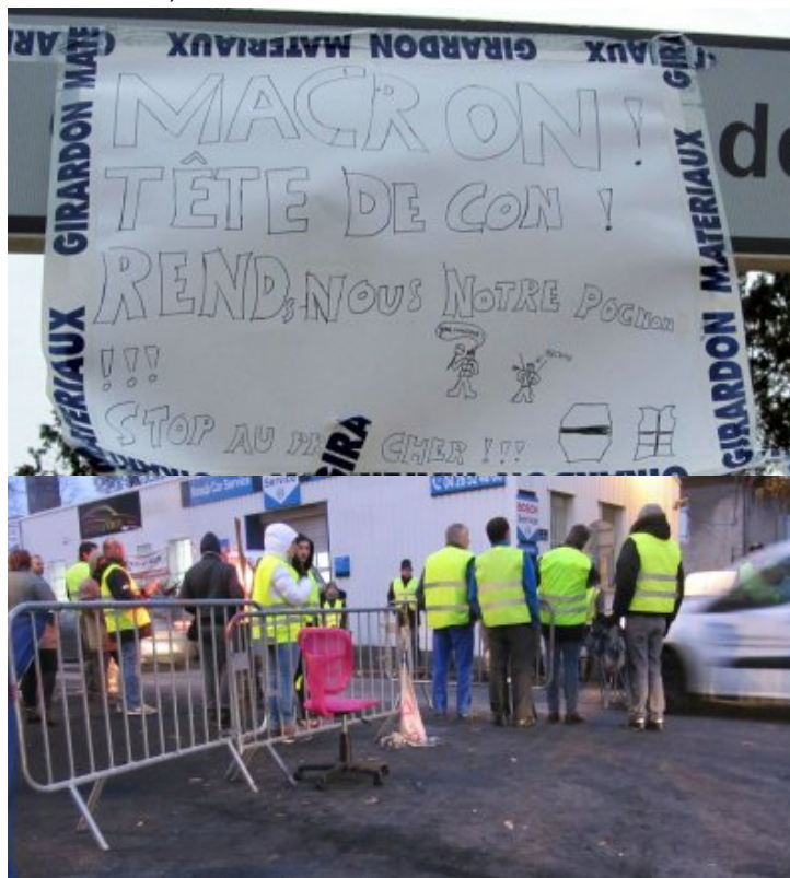
Drôme, Livron : blocage gilets jaunes au rond point, 19 novembre 2018

Les gilets jaunes de Livron et Lorient ont décidé d'être plus vigilants sur l'alcool et les personnes bourrées qui perdent les pédales, un incident pénible ayant eu lieu dimanche soir (un gilet jaune alcoolisé vexé de se voir demander de partir est revenu avec des armes, a tirer heureusement en l'air. Il a été battu et sa voiture brûlée. Il est en prison. On déplore un blessé percuté par sa voiture).