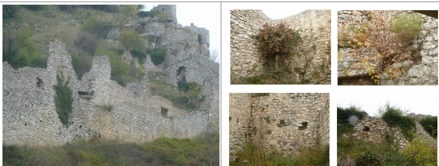
Végétations, état des murs sur le site

- Une attention particulière doit être prise pour que les aménagements techniques soient le moins visibles possible, soit par leurs couleurs, ou leur intégration dans le site (caissons, etc...).