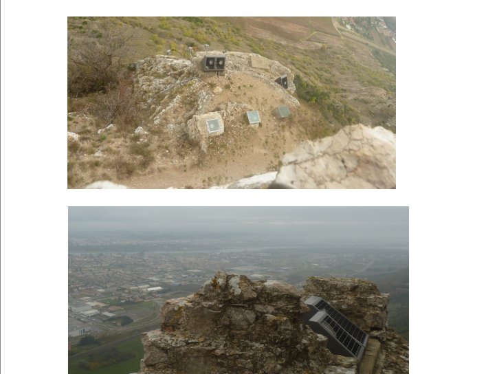
Aménagement des lieux