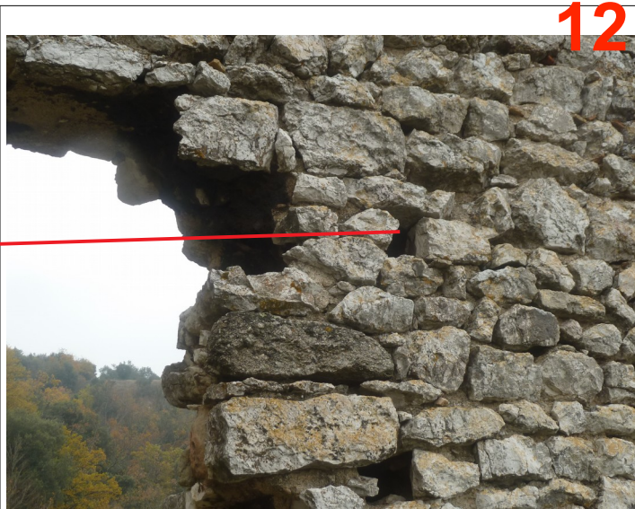
Porte haute, la maçonnerie se vide de son mortier