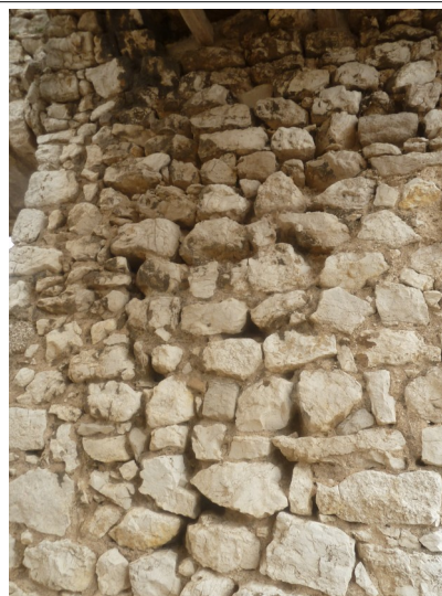
Première porte en bas du site